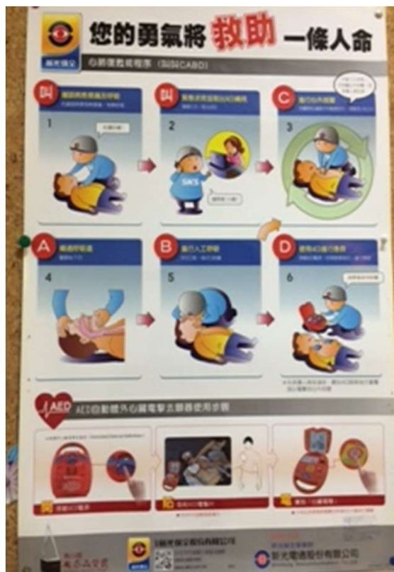
自動體外心臟體外電擊器